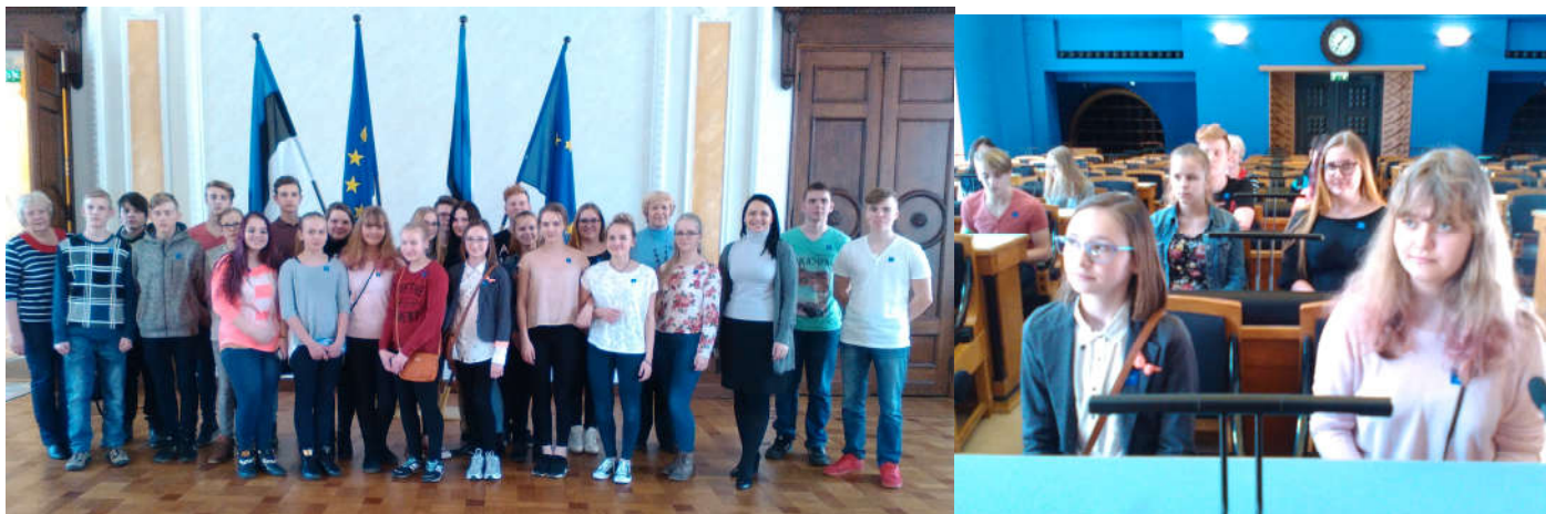
Riigikogu Valges saalis ja istungite saalis