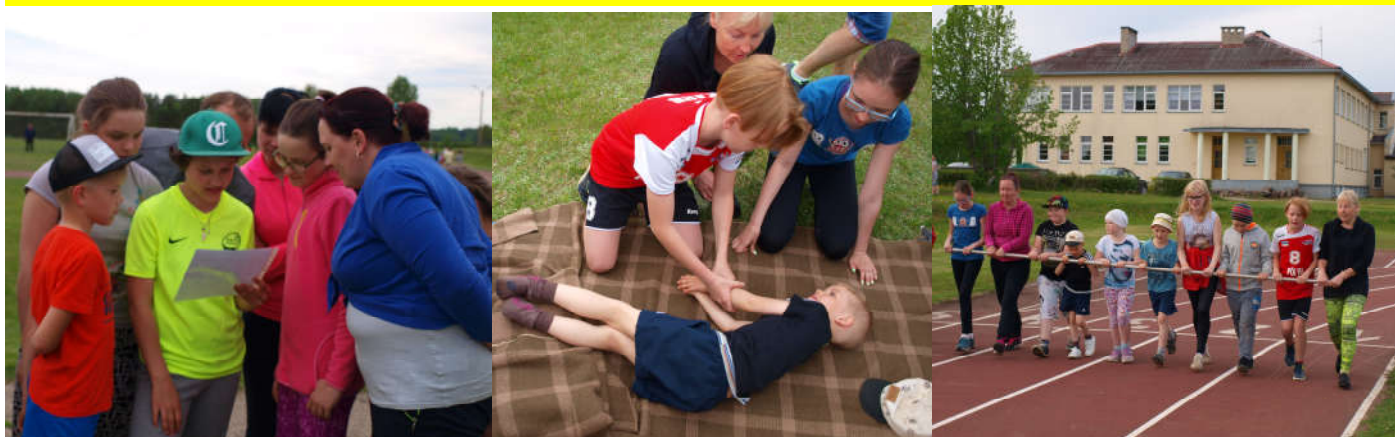
Kuidas lahendada olukord, kus õpilane minestab? Mida teha?