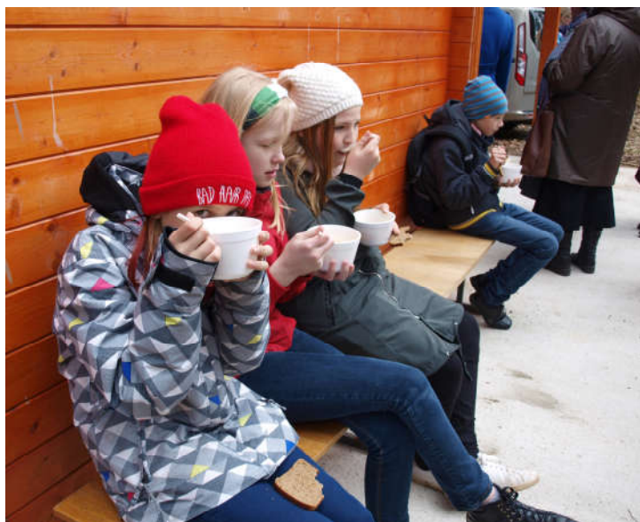
Päkapikumajas pakuti maitsvat suppi