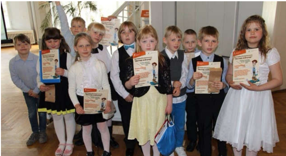
Tänukirjad kõigile osavõtjale.

Käesoleval aastal kuulutas Hull Teadlane välja projekti „Olen tragi, sordin prügi!“. Vahvast ettevõtmisest otsustas osa võtta ka meie 1. klass.