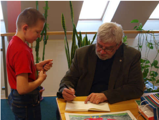
Kevinil oli kaasas oma raamat, kuhu ta kirjanikult autogrammi võttis.