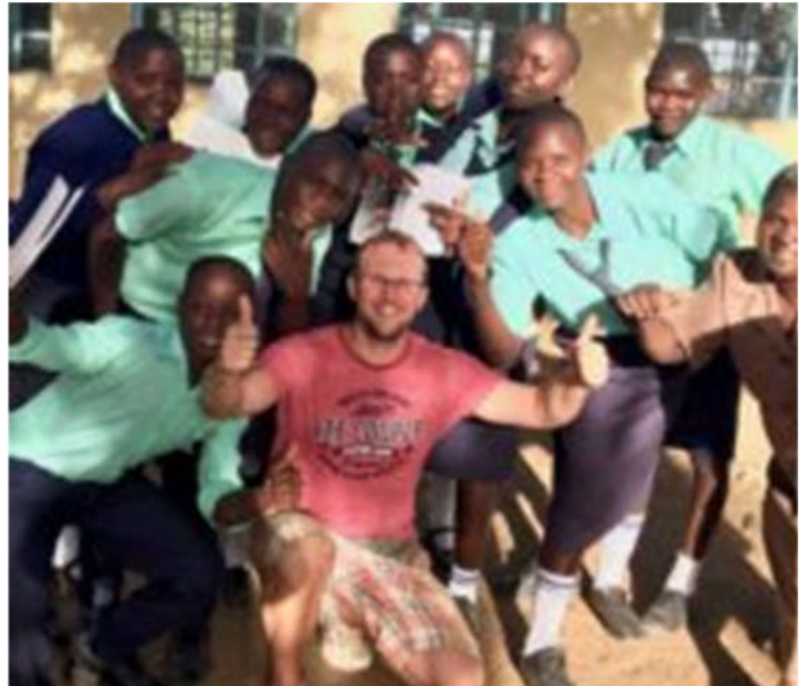
Koos kohalike koolilastega.