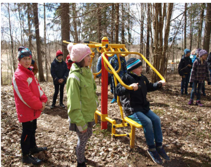
Orupedastikus jätkus tegevust kõigile