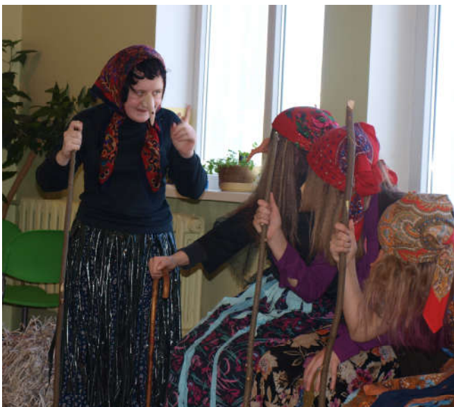
Põlva Mammaste kooli nõiad hoos