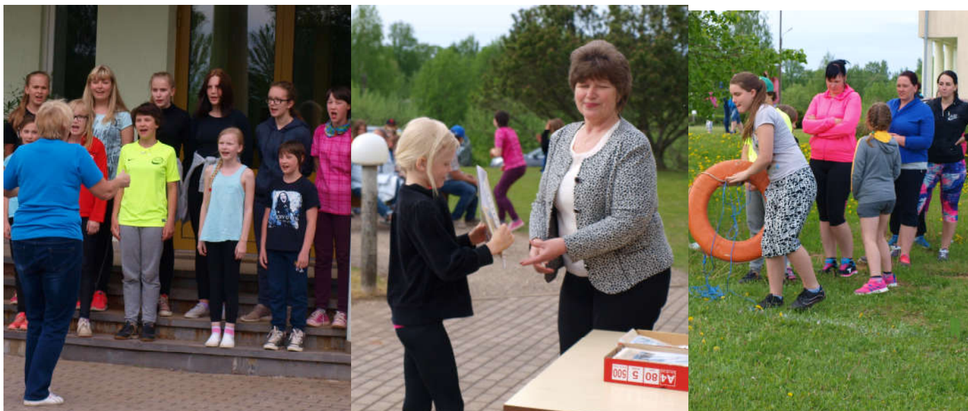
Esmalt väike kontsert, siis said kõik tublimad tunnustuse ja lõpuks lustlikud sportmängud.