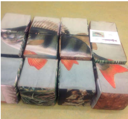
Kas sina tunnend seda kala?