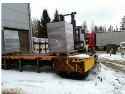
9.klass käis karjääriretkel, Teeviidal ja Lahedal Koolipäeval, õpetajad küpsetasid kodunduse klassis õunakooki ja suvikõrvitsakotlette.