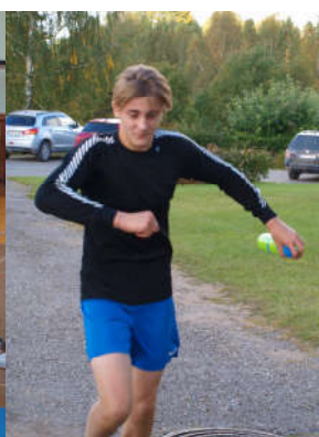
Tänavused Karaski- Krootuse jooksu liidrid.