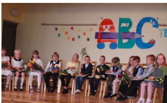
Uute õpilaste vastuvõtt 1. septembril

Kuller annab ülevaate viimase poole aasta tegemistest nii pildis kui ka sõnas