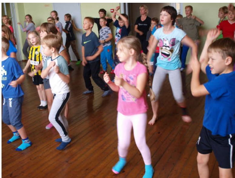
Püüdlilikult tantsukava harjutamas

Tubli sportliku saavutusega said hakka-ma ka 4.-5. klassi tüdrukud. Nemad saavutasid maakondlikul rahvastepalli võistlusel 3. koha.