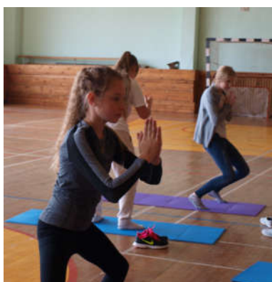
Lüigume tuju heaks.