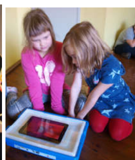
Väikesed tüdrukud püüavad midagi programmeerimisest sotti saada, suuremad määrivad lei-vale värskelt klopitud võid.