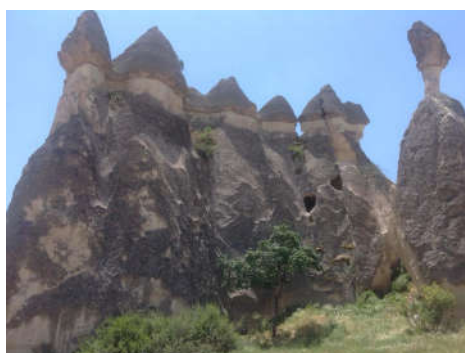
Suvemeenutusi kaugest Türgist ja siitsamast kodulähedalt Karilatsist