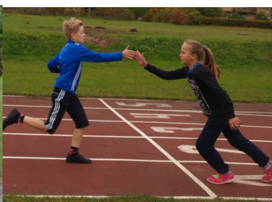
Üritame purustada maratonijooksu aega.