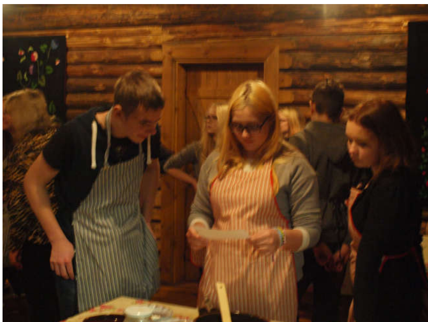
Retsepti tuleb hoolikalt lugeda, õiged kogused välja mõõta.

Jakobson rajas oma näidistalu kunagi selle eesmärgiga, et õpetada eestlasi õigesti talu majandama: põldu harima, vilja kasvatama, loomi pidama. Praegu jätkatakse Jakobsoni head eestvõtmist sellega, et talu tegeleb isemajandamisega ja kogu haridusprogrammides vajaminev tooraine toodetakse talus.