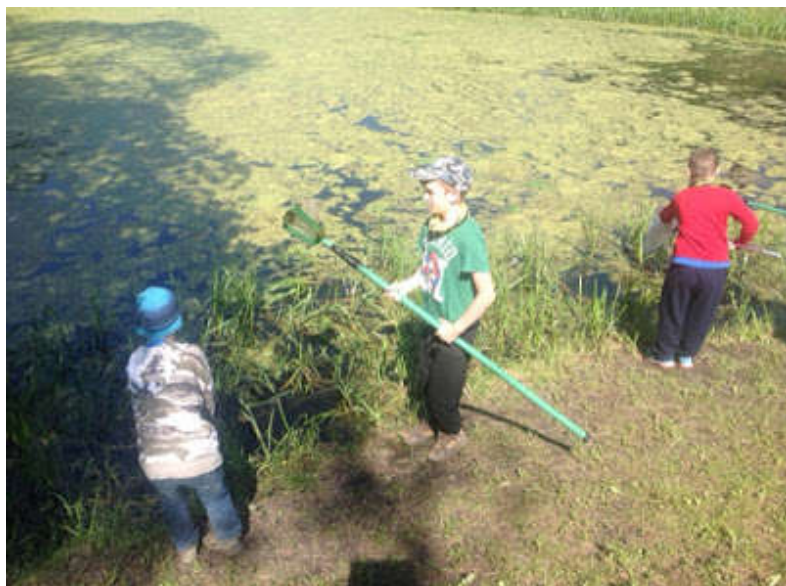
Sauna taga tüügi ääres? Ei, hoopis Emajõe Suursoos

Emajõgi voolab esmapilgul nii rahulikult ja elutult mööda oma sāngi, kuid tultes aga Emajõele lähemale ja jälgides tema aeglast liikumist, võib peagi märgata palju sagimist ning milline tohutu elu käib vee pinnal kui ka vees. Kellele on jõgi koduks ning miks just jõgi, mitte meri? Nendele küsimustele otsisime ja leidsime oma programmis vastuseid. Programmis osalemiseks ja transpordiks saime rahastuse Keskkonna Investeeringute Keskuselt.