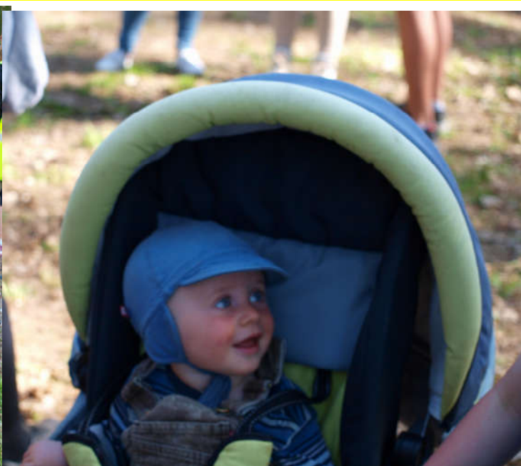
Tervisekõnnile tuli nii suuri koeri kui ka päris pisikesi poisse.