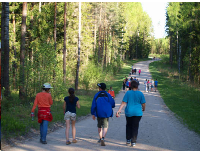
Igäüks valis matkaks endale sobiva tempo.