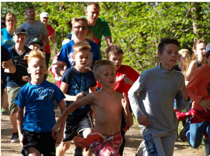
Miiljooksu start on antud.