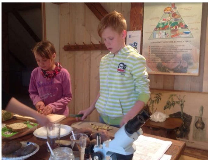
Uuriti, mis on kartuli sees.