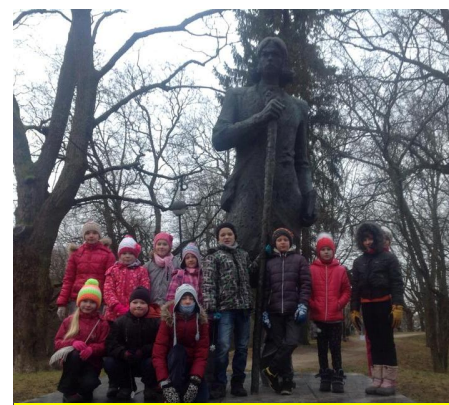
Kristjan Jaak Petersoni kuju ees

Üritusel premeeriti noorsootöö tublimaid tegijaid ning oli võimalus kaasa lüüa osaluskohviku töös.