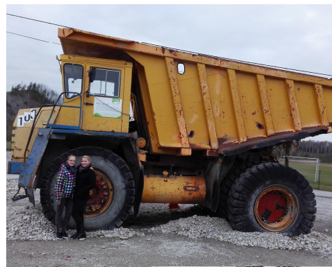
Ülal: kaevanduses kasutusel olnud võimas auto.

Enne kojuõitu tegime linnuses veel palju pilte.