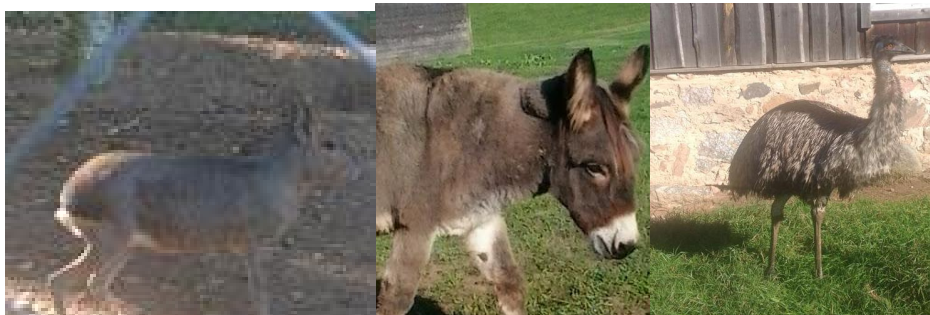
Kas kits või jänes?

Uudistada sai kanu, faasaneid, kalkuneid, parte, hanesid ning mitmeid eksootilisi linde. Peale lindude nägime talus külikuid, lambaid, ponisid, alpakasid, minisiga, kitsi jne. Väga põnevad loomad olid maarad, kes meenutasid välimuselt hiigeljäneseid, olid ainult lühemate kõrvadega.