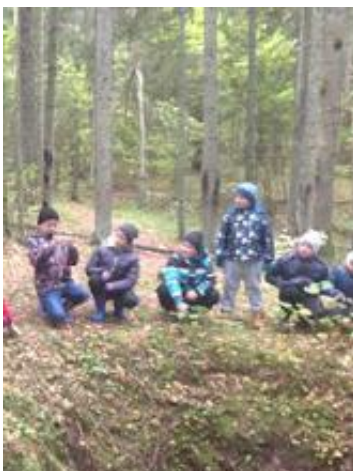
Selles augus oli metsavendade punker.

Reis sai teoks Põlva Metsaomanike Liidu toetusel.