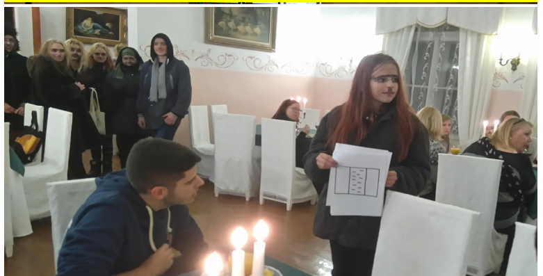
Külalised jõudsid Cantervillasse mardilauapäeva õhtul. Mardisandid ei jätnud kasutamata võimalust tutvustada meie rahvakalendri kombeid ka võõramaalastele.