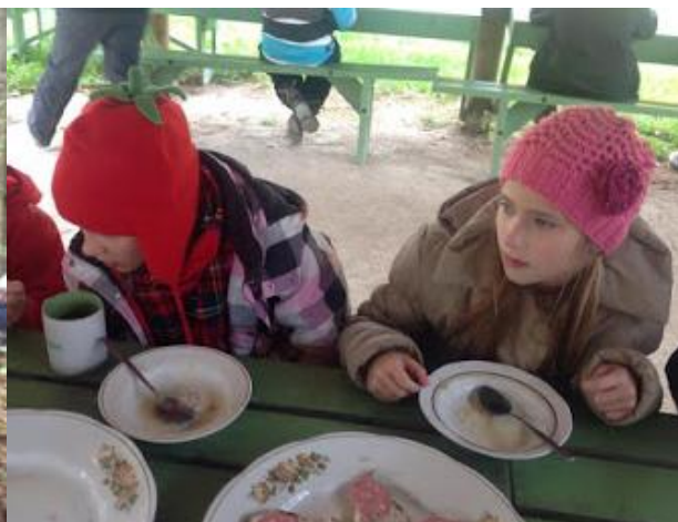
Värske õhk tegi kõigil kõhud tühjaks.