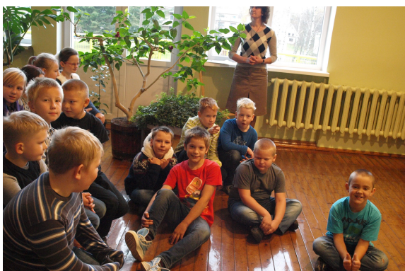
Lastele meeldib ikka lugusid kuulata.