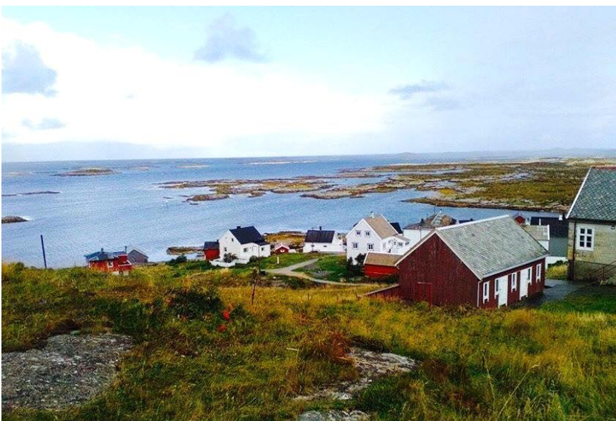
Sula saareke, kus elab umbes 50 inimest.