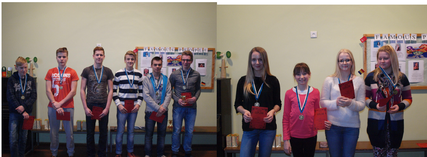
Meie kooli tugevaimad poisid ja tüdrukud