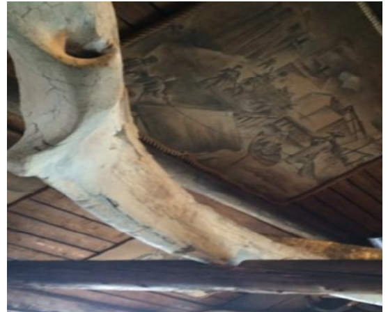
Hüigelsuur vaalaluu muuseumi laes.