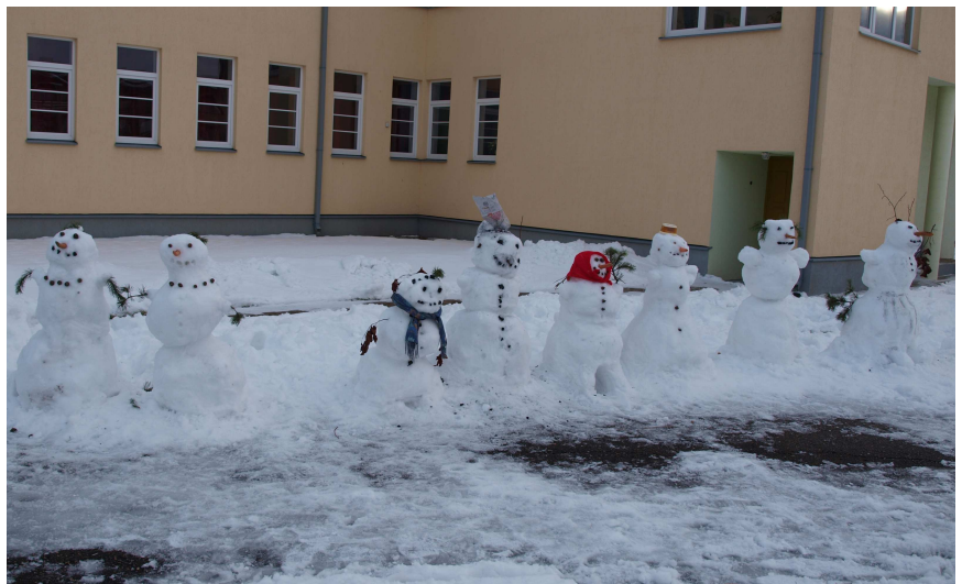
Lumememmed, joondu! Valvel!