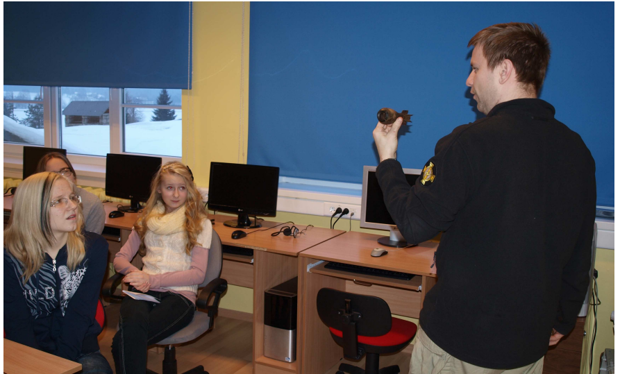
Õpilastele näidati erinevaid lõhkekehasid.

Õpilastele näidati õhvastavaid pilte lõhkekehade ja juhtunud õnnetustest. Samas saime ka teada, et isegi tavaline kodukeemia võib osutada vale kasutamise korral väga ohtlikuks.