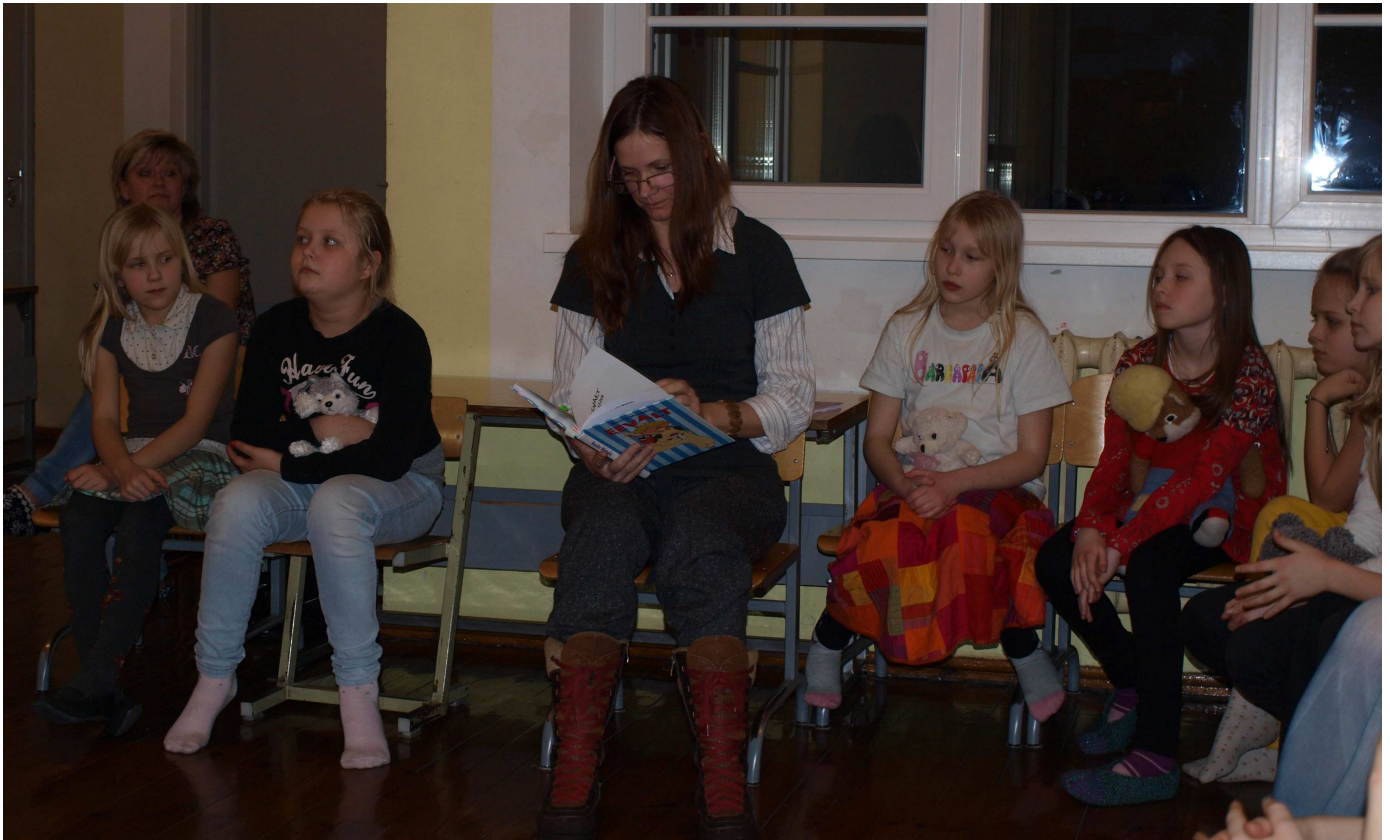
Renita loeb sellest, kuidas Pillest sai Eevalt.