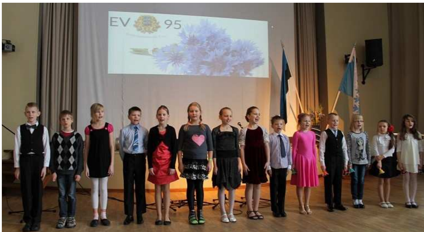
Esineb mudilaskoor võrokeelse lauluga "